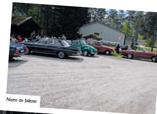
Noen av bilene