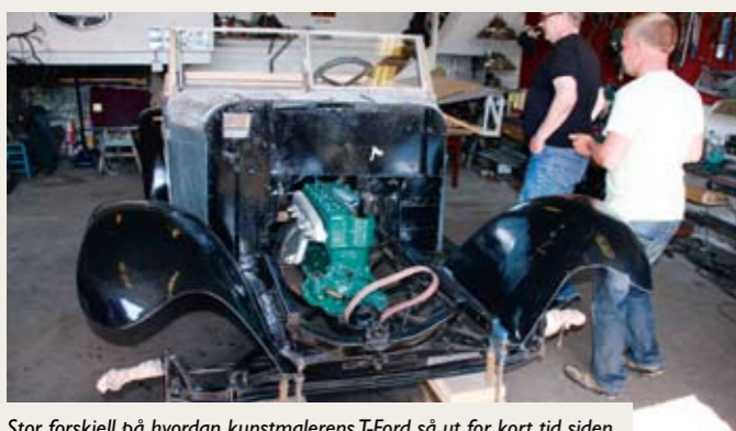
Stor forskjell på hvordan kunstmalerens T-Ford så ut for kort tid siden