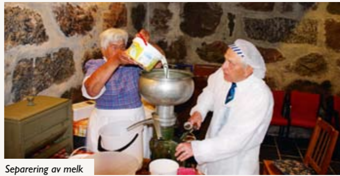
Separering av melk