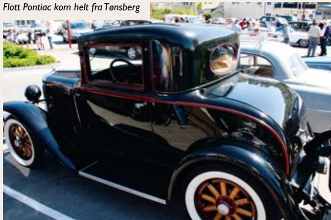
Flott Pontiac kom helt fra Tønsberg