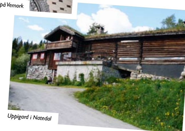
Uppigard i Natedal