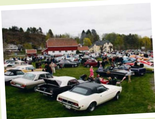
REKORDFREMMØTE KRISTI HIMMELFARTSDAG