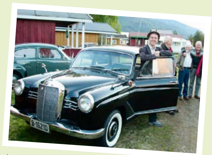
SØRENDINGER PÅ FLÅKLYPA-LØPET