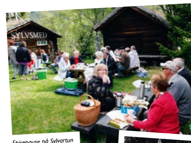
Spisepause på Sylvartun