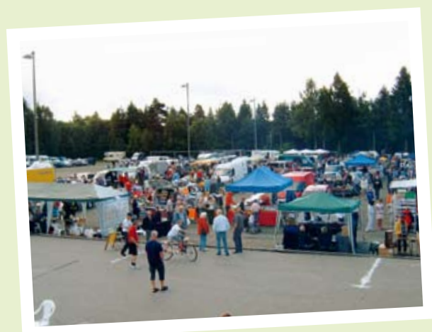
VELKOMMEN TIL DELEMARKE!