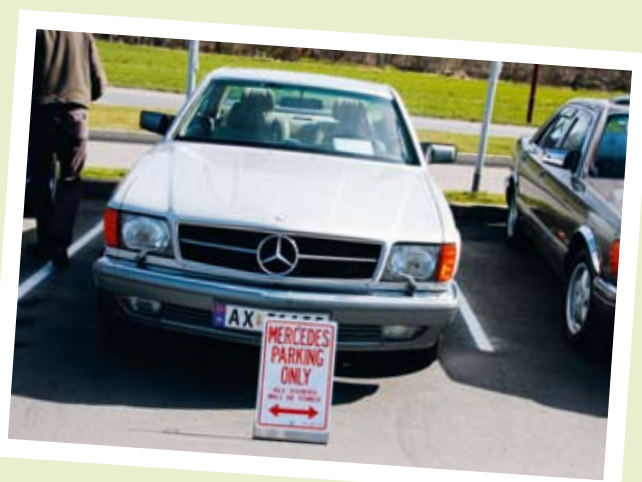
MERCEDESTREFF I LYNGDAL