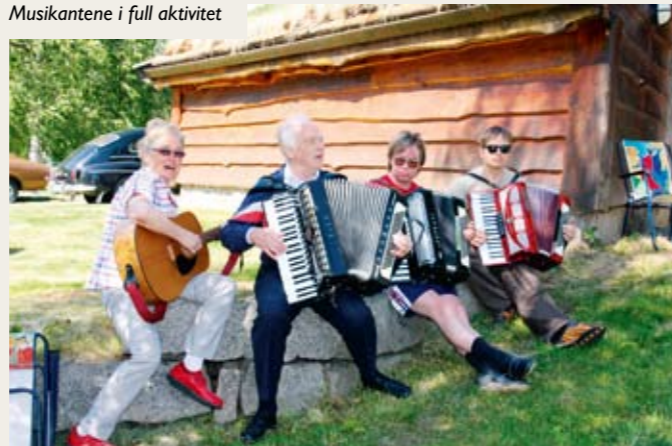
Musikantene i full aktivitet