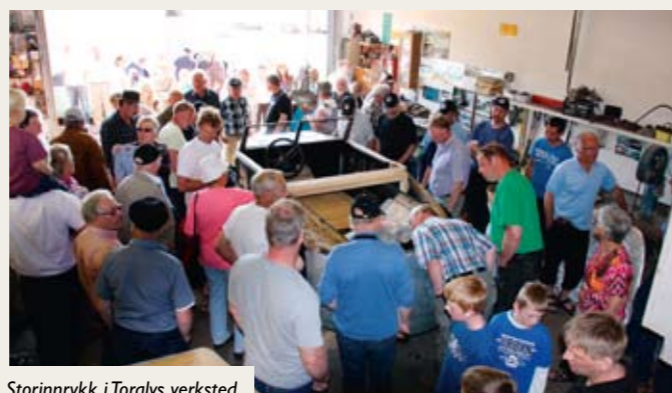
Storinnrykk i Toralvs verksted