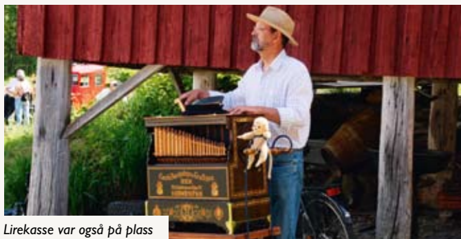
Lirekasse var også på plass