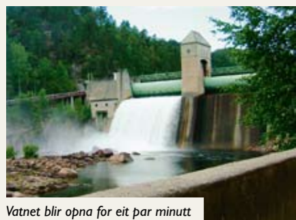
Vatnet blir opna for eit par minutt