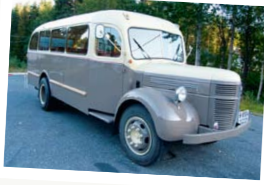
Volvo buss 51 mod.