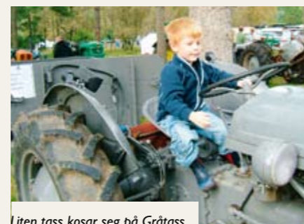
Liten tass kosar seg på Gråtass