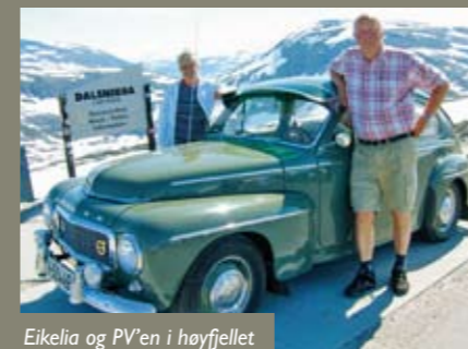
Eikelia og PV'en i høyfjellet