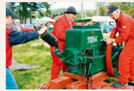
Å starta ein Trygg for tresking er fleire manns jobb.