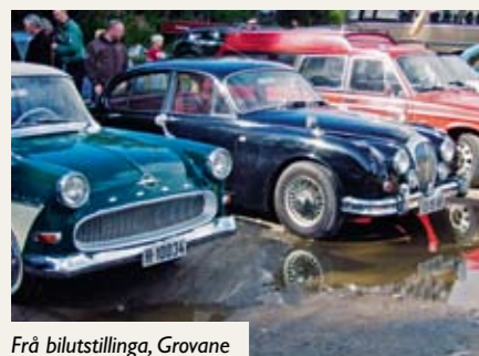
Frå bilutstillinga, Grovane