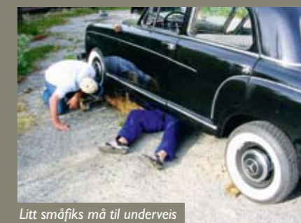
Litt småfiks må til underveis