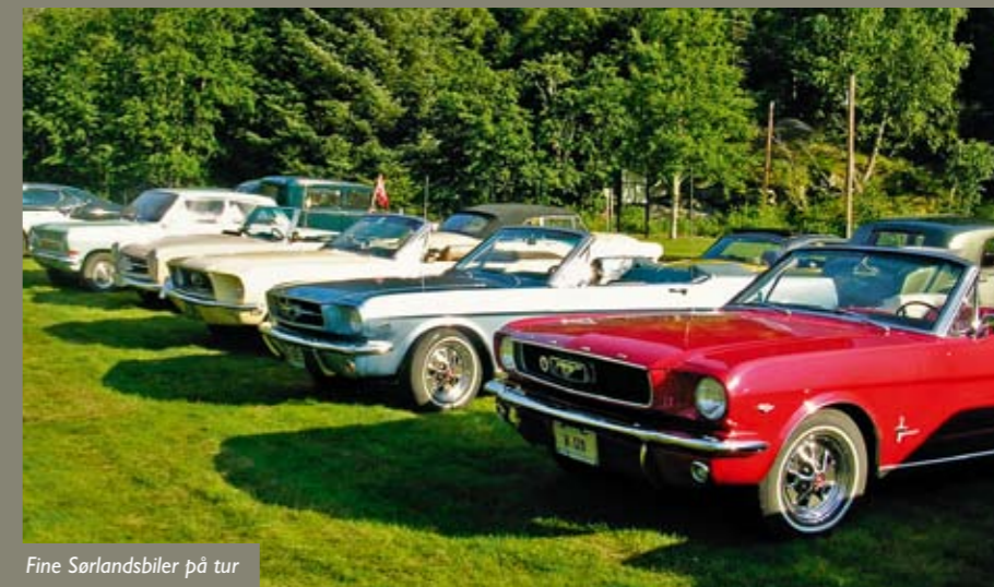
Fine Sørlandsbiler på tur