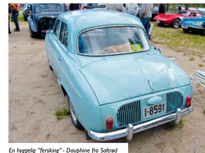
En hyggelig "fersking" - Dauphine fra Saltrød