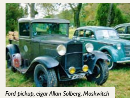
Ford pickup, eigar Allan Solberg, Moskwitch 1954 mod, eigar Øystein Klev, Mandal.