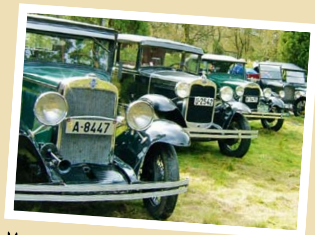
MYE FINT PÅ DYRSKULET