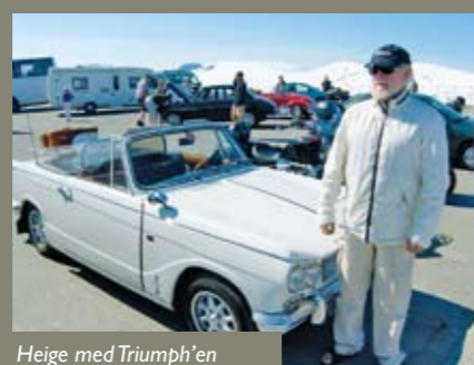
Heige med Triumph'en