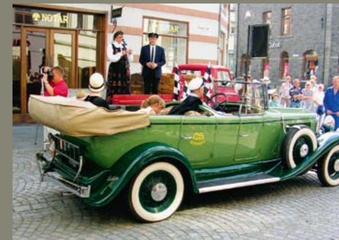
En av de flotte lokale skyssvognene fra 20-tallet