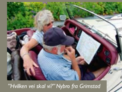
"Hvilken vei skal vi?" Nybro fra Grimstad lurer fælt nå