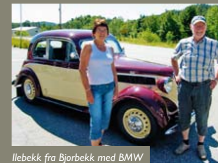
Ilebekk fra Bjorbekk med BMW