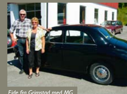
Eide fra Grimstad med MG