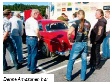
Denne Amazonen har 15000 km. på telleren!