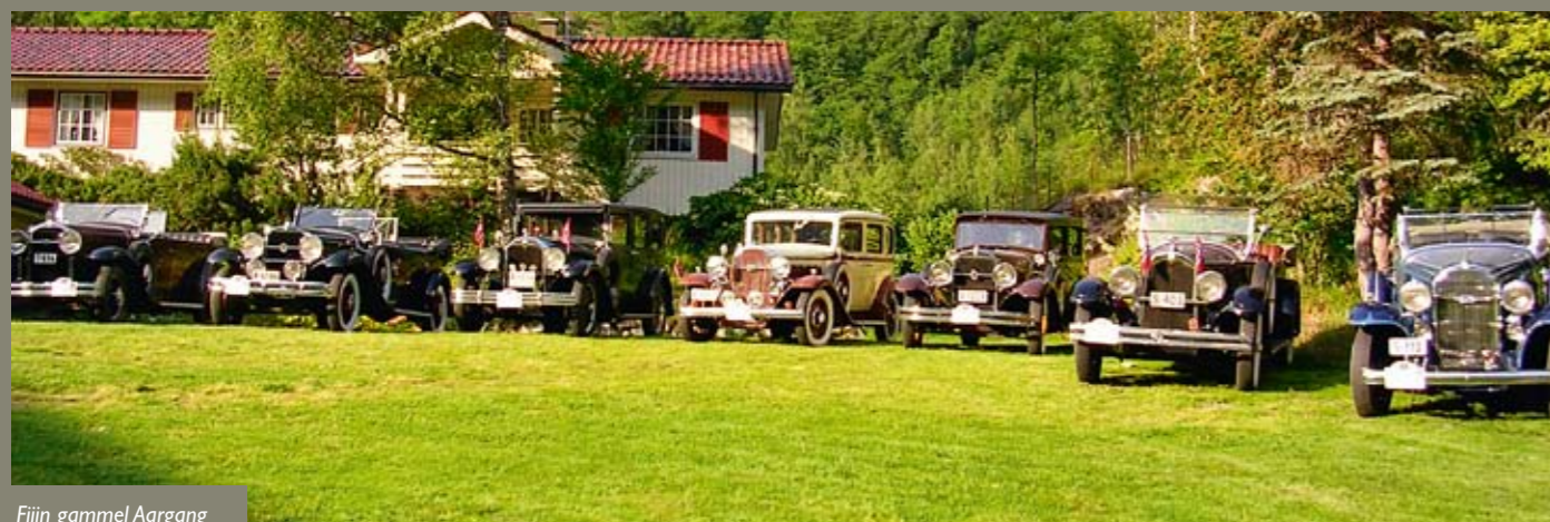
Fiin gammel Aargang