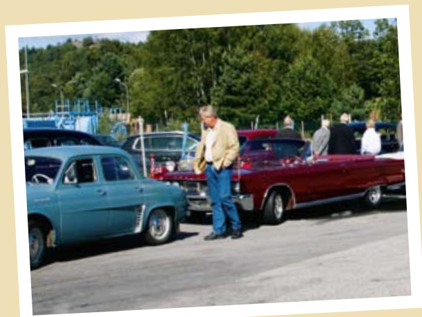
ÅPNING AV E-18