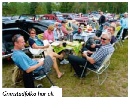
Grimstadfolka har alt tenket seg.