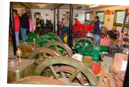
Til venstre: Stort og romslig lokale i Gjerstad