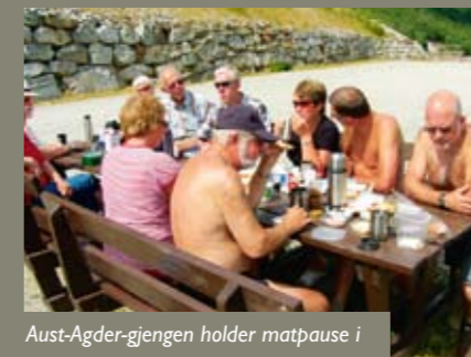
Aust-Agder-gjengen holder matpause i flott vær