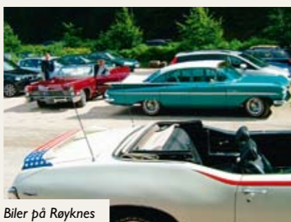
Biler på Røyknes