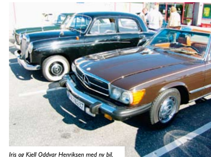
Iris og Kjell Oddvar Henriksen med ny bil.