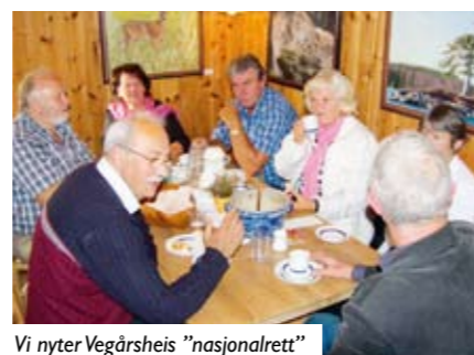
Vi nyter Vegårsheis "nasjonalrett" elgsuppe og søsterkake!