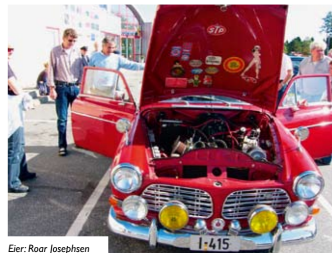
Eier: Roar Josephsen