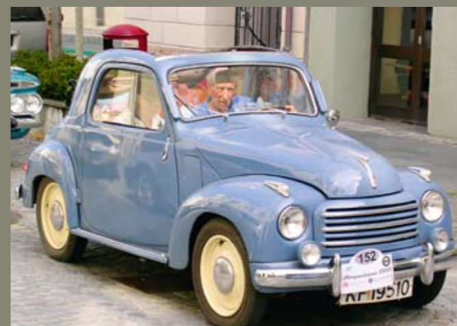
Løpets minste bil?