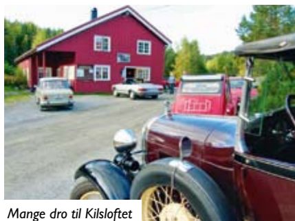
Mange dro til Kilsloftet etter turen.