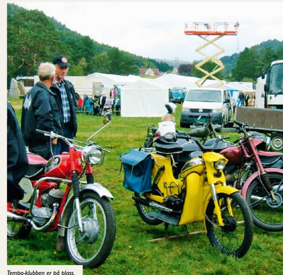
Tempo-klubben er på plass.