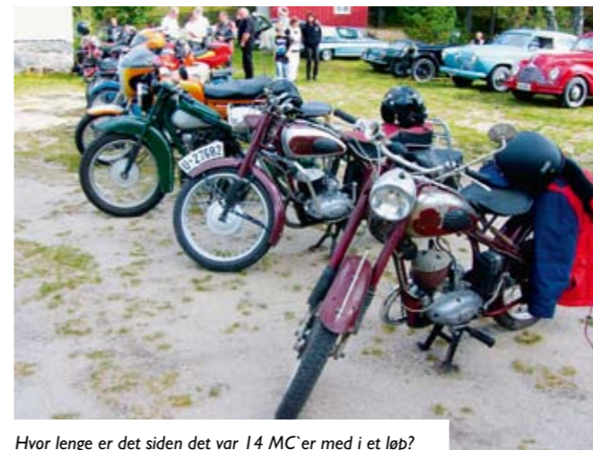
Hvor lenge er det siden det var 14 MC'er med i et løp?