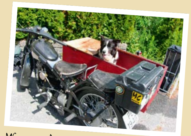
MC-TREFF I ARENDAL