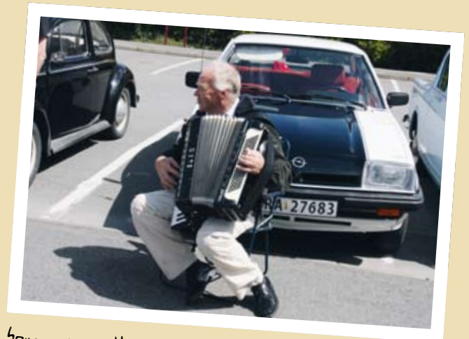
SPILLEMANN I KVINESDAL