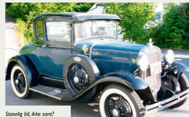
Staselig bil, ikke sant?