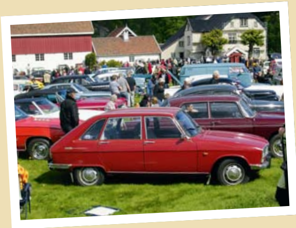
MANGE BILER I FRØLAND