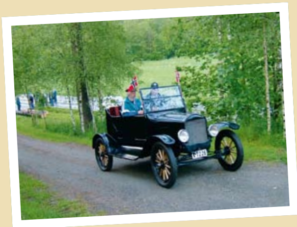
"Nybygd" T-FORD I LYNGDAL