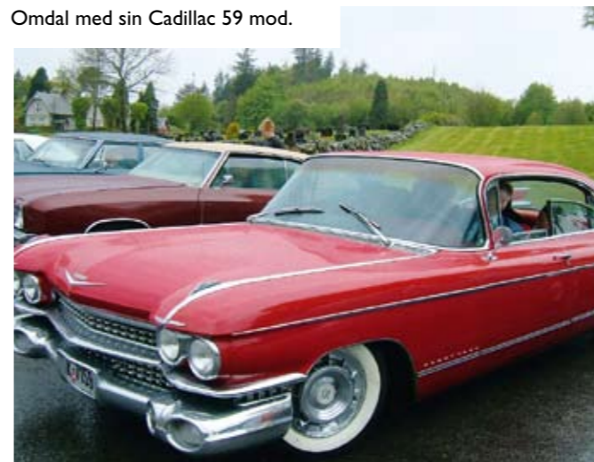
Omdal med sin Cadillac 59 mod.