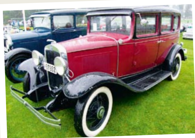
Dette synes publikum og juryen var de fineste kjøretøyene

En jury skulle også utpeke to "dagens bil", fra henholdsvis før 1950 og etter 1950 samt motorsykkel. Dette er en vanskelig oppgave! Vanligvis er det nok de mest prangende som får denne prisen, og gjerne de som har "nyhetens interesse". I år valgte juryen litt annerledes.