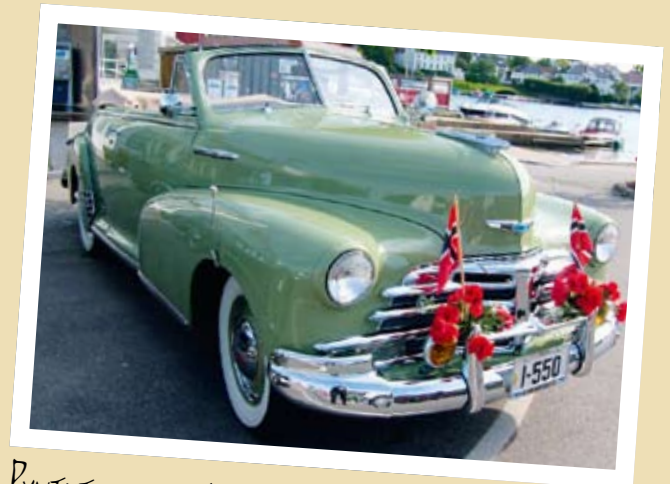
RYNTET FOR JUBILÉET