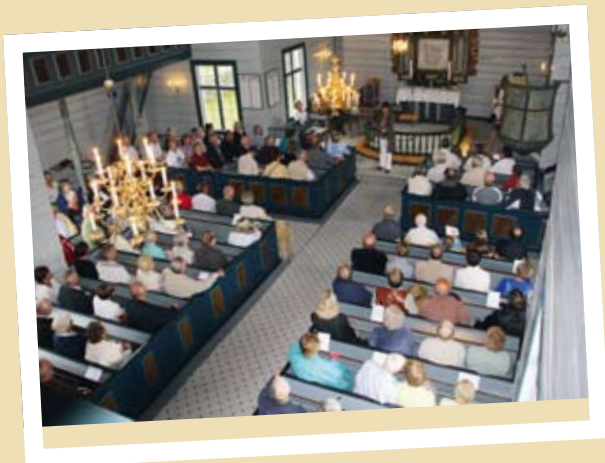
FULLSATT KIRKE I ÅSERAL