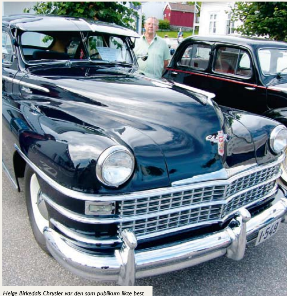
Helge Birkedals Chrysler var den som publikum likte best