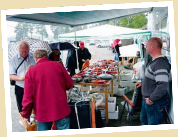
GOD HANDEL PÅ VELEMARKEDET