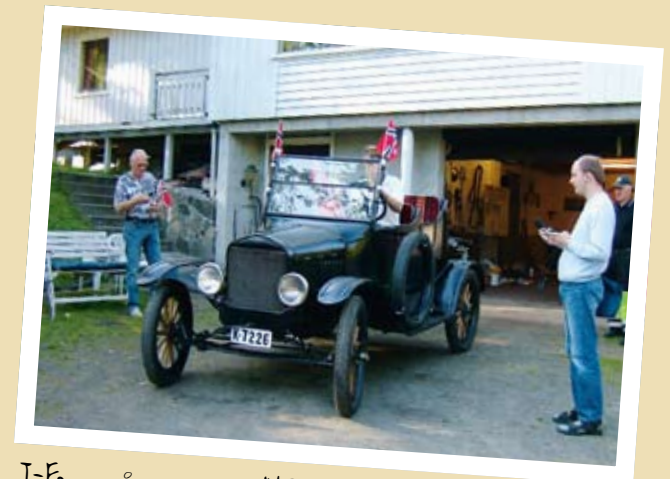
T-FORD PÅ TUR MED NRK