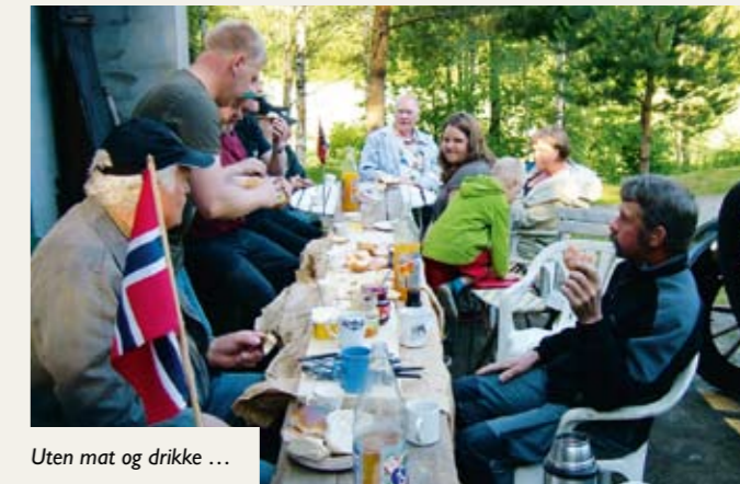
Uten mat og drikke ...