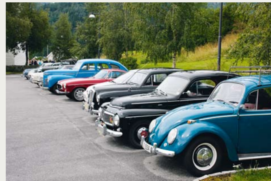
Ikke alle biler var like gamle, men ingen var større enn denne!