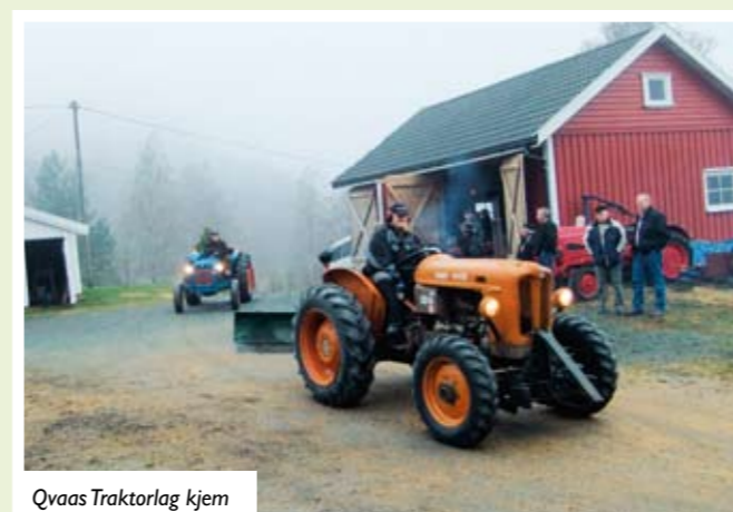
Qvaas Traktorlag kjem