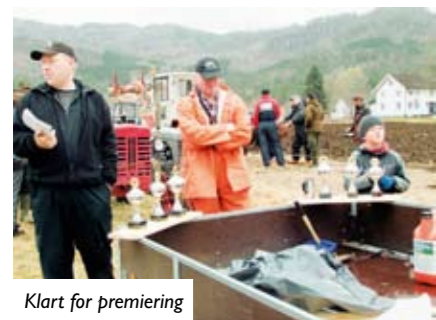
Klart for premiering