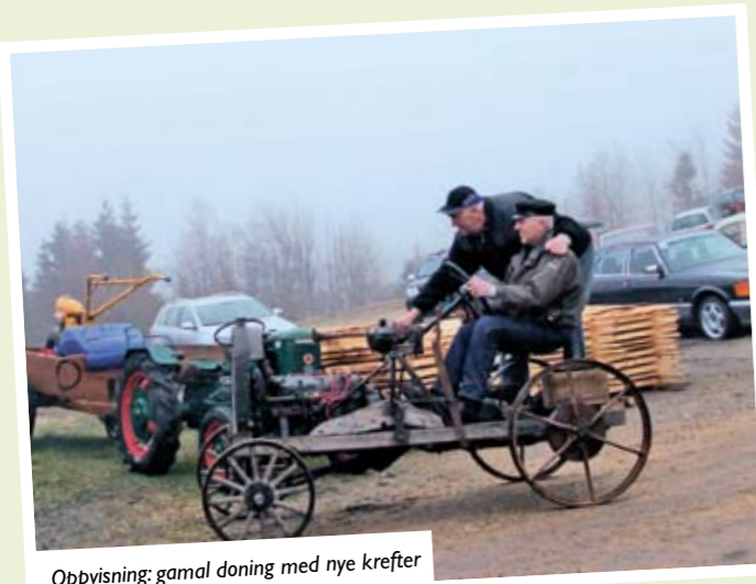
Oppvisning: gamal doning med nye krefter