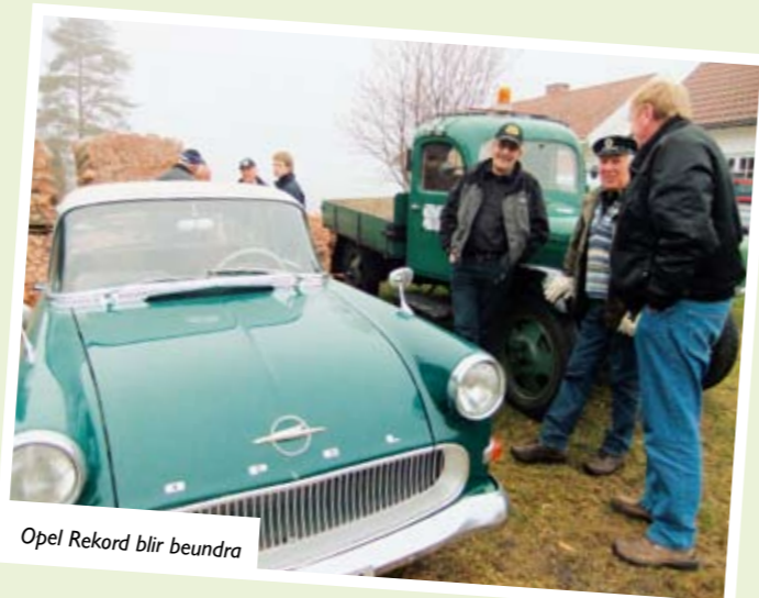
Opel Rekord blir beundra