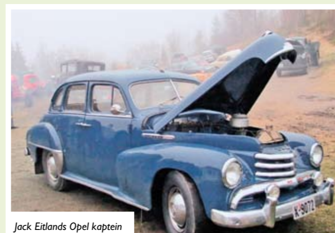
Jack Eitlands Opel kaptein