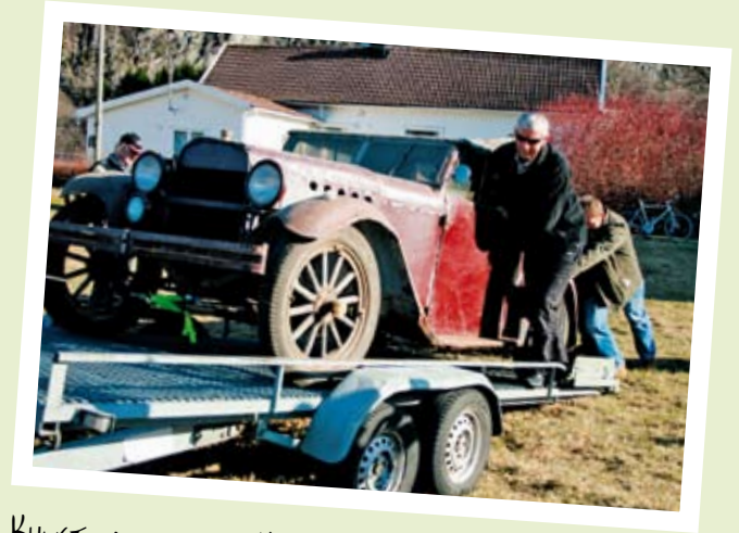
KUNSTMALERBILEN I KVINESDAL