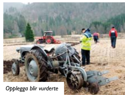
Opplegga blir vurderte