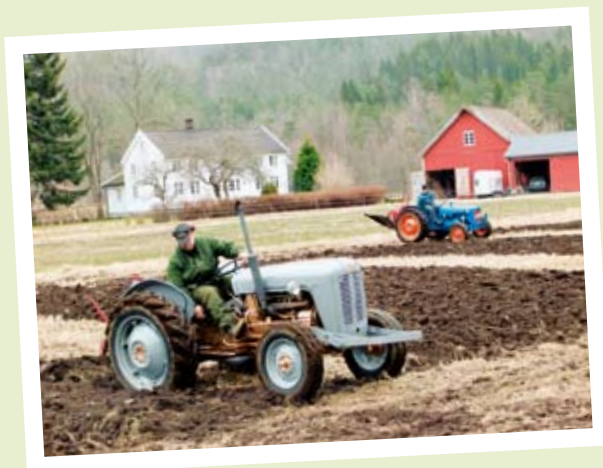
VÅRANN I KVÅS