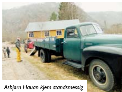
Asbjørn Hauan kjem standsmessig