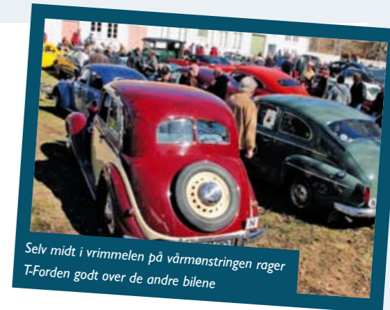
Selv midt i vrimmelen på vårmonstringen rager T-Forden godt over de andre bilene