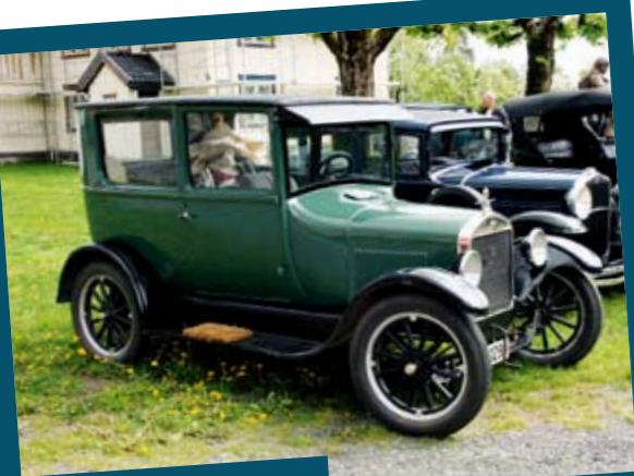
Arkivbilde av T-Forden til Lorentz

Første stopp er Esso i Osedalen. Forden trenger påfyll av mer flytende væske, tilsatt blyerstatning. Jeg trør ned venstre pedal kl. 0842 og setter kurs innover i landet. Filler'n, 12 minutter bak skjema jamført med E-18 farerne. Men det skal jeg nok klare å kjøre inn. Forden drar bra på opp bakken og jeg svinger av til venstre, mot Reiersøl og Furre bro. Ved planteskolen kommer en grushaug uforvarende på. Jeg trør febrilsk på alle pedaler, men treffer likevel humpelen med for stor fart. Ca. 200 meter lenger borte stopper jeg for å slippe forbi damen i BMW bak meg. Til min forundring stopper hun også. «Du mista noe!» roper