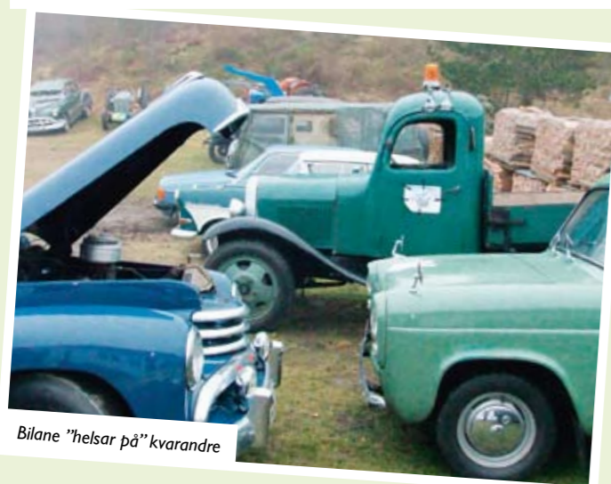
Bilane "helsar på" kvarandre