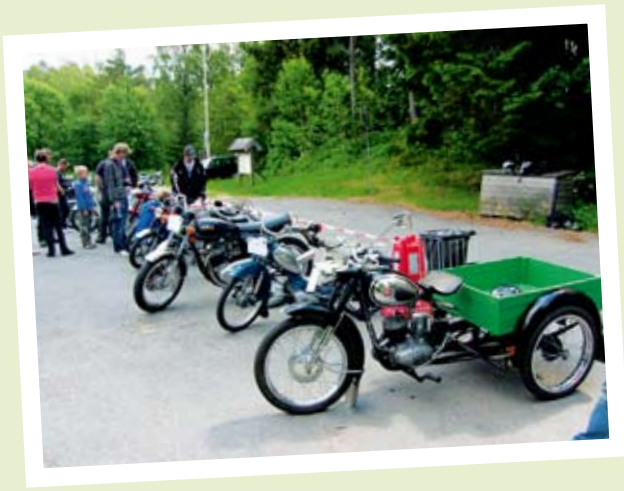
MC-TREFF I ØST I JUNI