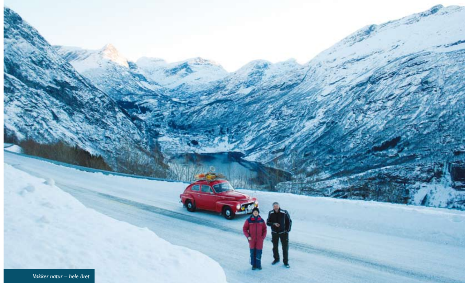
Vakker natur – hele året