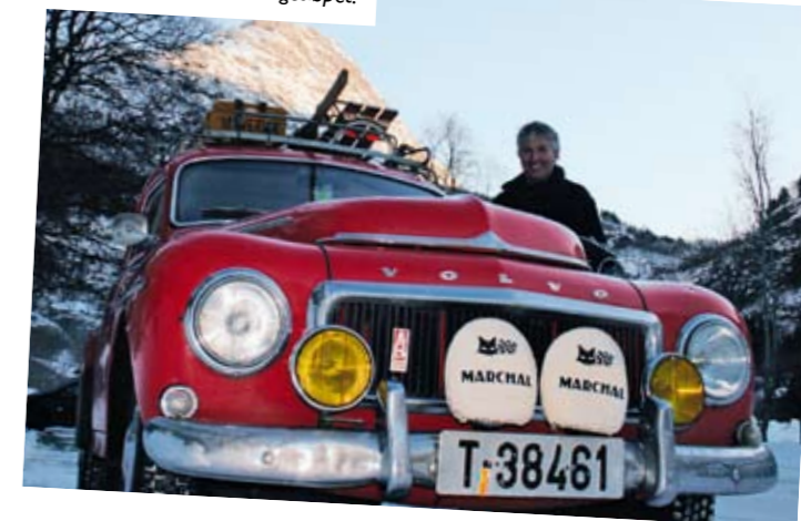
Klar til start på Vinter-Norgesløpet!