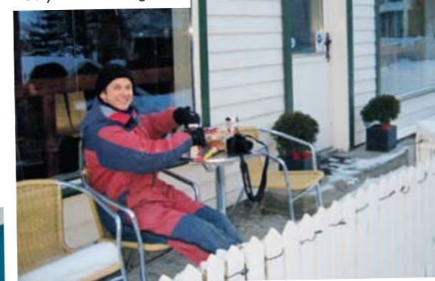
Vi benyttet uteserveringen...

meg. Når jeg tar ham igjen står han strålende nede ved fjorden og har aller mest lyst til å skrike seg til ein tur til. Men nå venter målgang og flott lunsjbord på Union Hotell! Vi er til og med inne på tanken på å ta oss et varmt boblebad ute på terrassen.