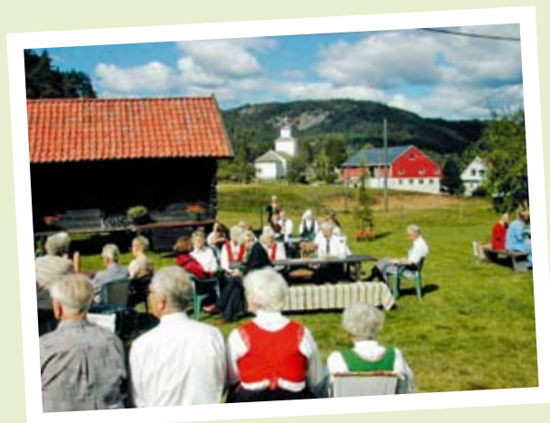
VELKOMMEN TIL PORSMYR 5. JUNI!