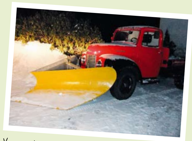
VINTER I LYNGDAL