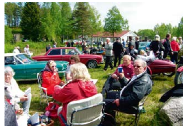
Vel møtt på Harebakken torsdag 13. mai kl. 11.00 til nok en hyggelig Kr. Himmelfartstur, det 9. år på rad fra Harebakken! Passerer vi 300 i år?