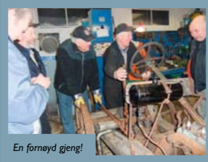
En fornøyd gjeng!