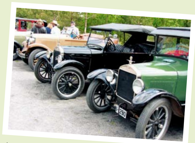
SNART HIMMELFARTSTUR IGJEN!