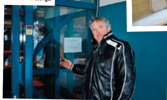
Hotellet var stengt!

Når vi kommer til Linge gjør vi et unntak fra løpstraseen. Lunsjen på Muritunet regner vi enten er blitt kald eller har gått til grisene så lenge etter normalstart, så vi dropper omveien til Valldal og kjører rett til ferja. Det gjør ingenting om vi er litt sultne når vi ankommer Geiranger. Vi har nemlig bestemt oss for å koste på oss ein bedre lunsj-buffet på Union Hotell.