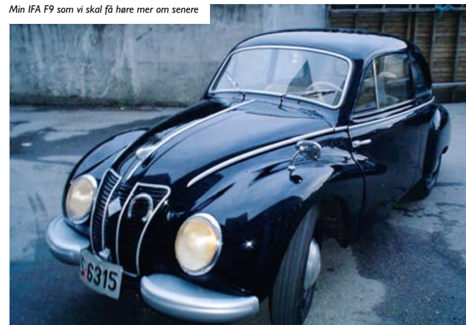
Min IFA F9 som vi skal få høre mer om senere

med ut på lageret. Her beordret han oss til å strekke ut armene, for deretter å stable så mange kjekspakker som overhodet mulig i armene våre. Det skulle vel ansees for å være en ekstra-bonus, men sannheten var vel heler at to unggutter mer oppfattet det som en straff å måtte bevege seg ut i byen og ned til rutebilstasjonen med armene proppfulle av kjekspakker! Selma, Marie og Kornmo, og en masse annet jeg i dag heldigvis har glemt navnet på. Jeg er tross alt kraftig løsemiddel-skadet! Jeg spiser fortsatt ikke kjeks!!