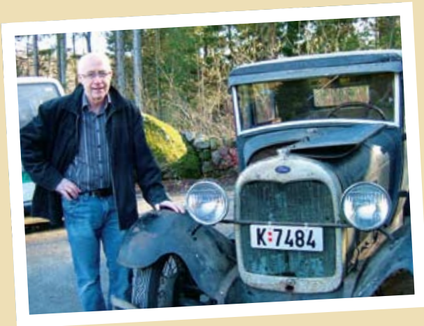
EN GAMMEL BIL ER IGJEN PÅ VEIEN