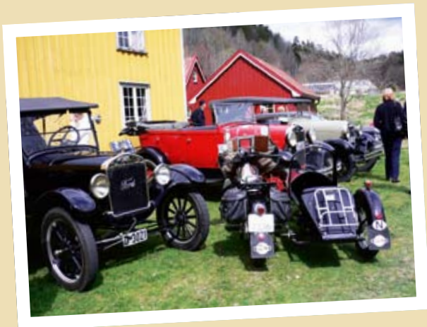
KLAR FOR KRISTI HIMMELFARTS-LØP IGJEN