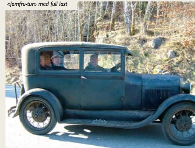
«Jomfru-tur» med full last