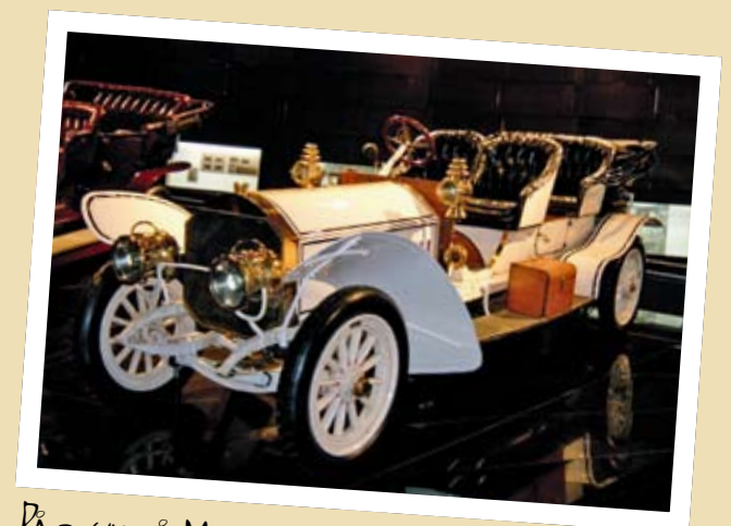
PÅ BESØK PÅ MERCEDES-MUSEET I STUTT GART