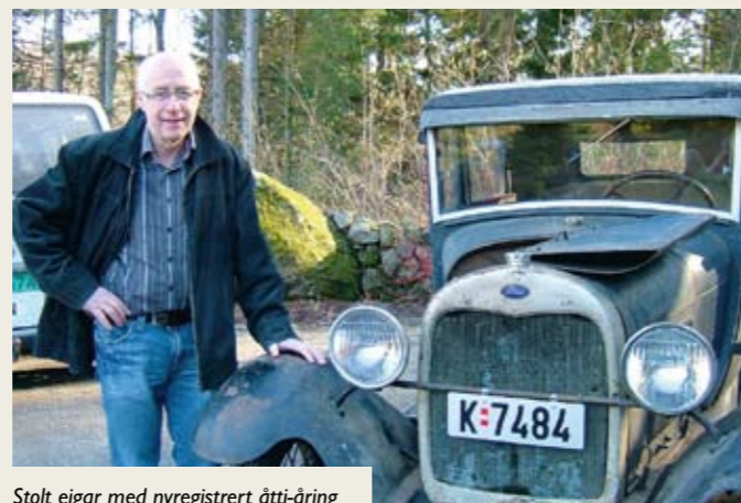
Stolt eigar med nyregistrert åtti-åring