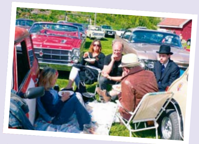
KLART FOR KRISTI HIMMELFARTS-TUR