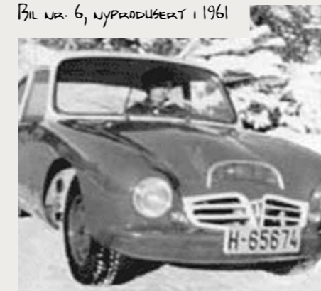
BIL NR. 6, NYPRODUSERT I 1961