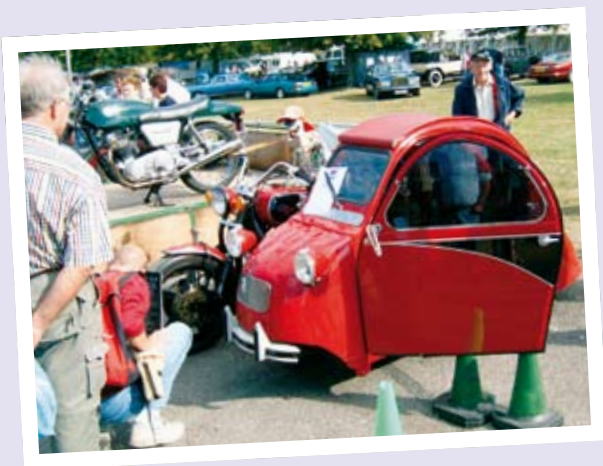
MYE RART PÅ BEAULIEU