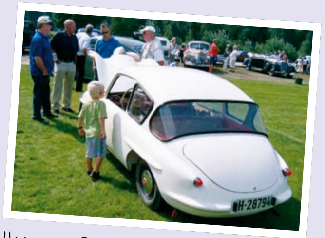
HISTORIEN OM TROLL