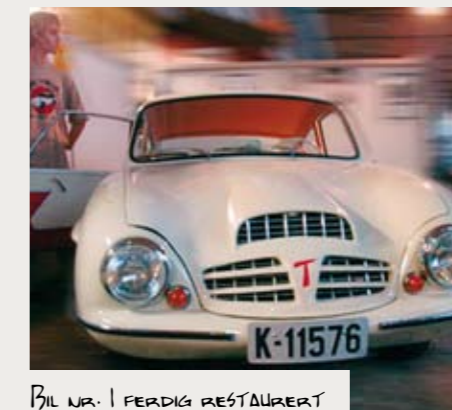
BIL NR. 1 FERDIG RESTAURERT