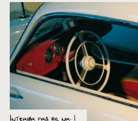
INTERIØR FRA BIL NR. 1