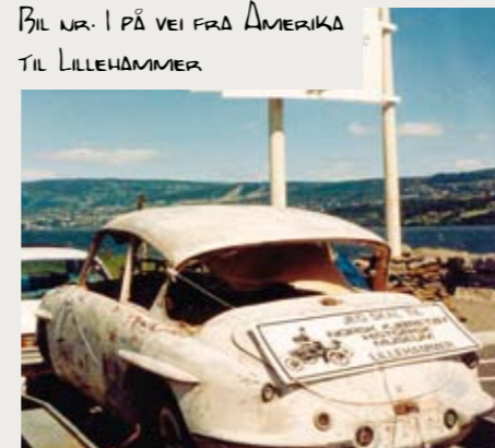
BIL NR. 1 PÅ VEI FRA AMERIKA TIL LILLEHAMMER