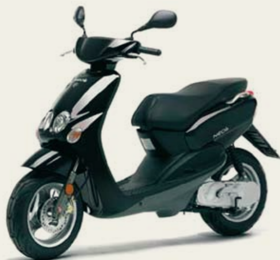
YAMAHA NEOS SCOOTER ER ÅRETS GEVINST!