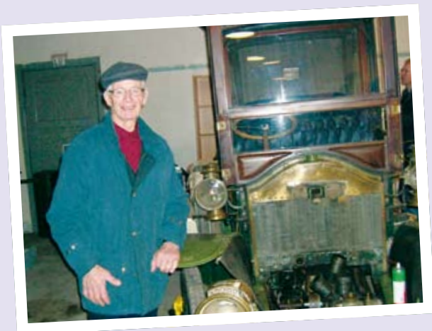
RENAULT PÅ LISTA