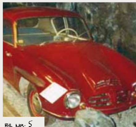
BIL NR. 5