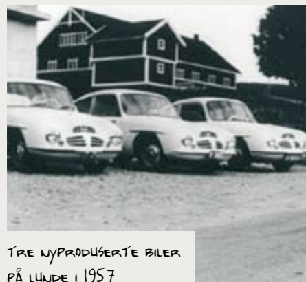
TRE NYPRODUSERTE BILER PÅ LUNDE I 1957

Og slik endte det – snipp snapp snute, så er eventyret ute...!