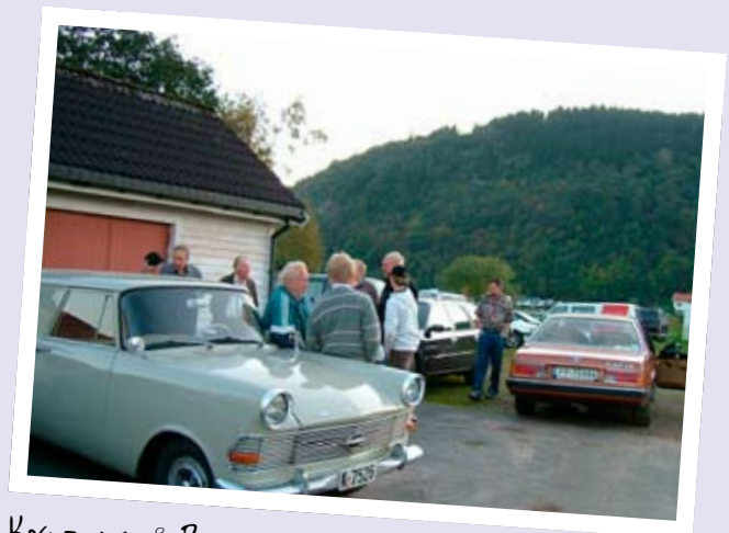
KOSEPRAT PÅ ROSEJORD