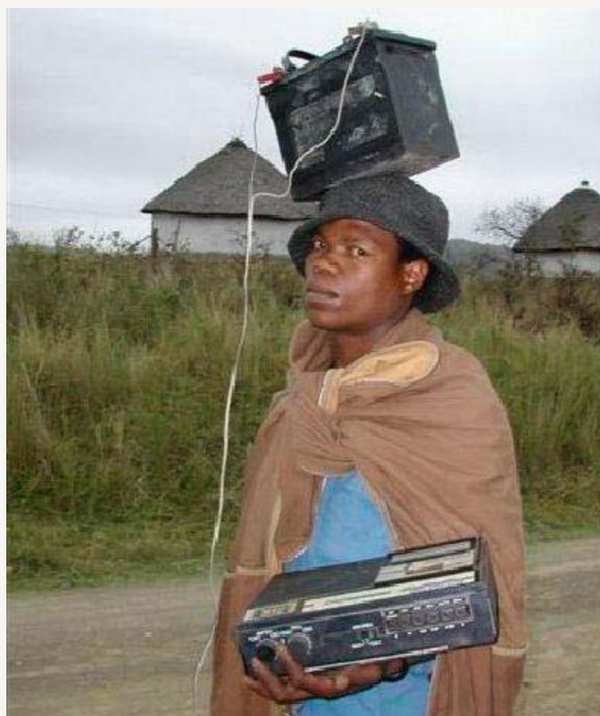
Her ser dere en afrikansk løsning på mobilradio. Bilen mangler, men et gammelt batteri og god balansekunst pluss en mobilradio med kassettspiller holder lenge. Bildet er fra Liberia.

Denne karen fant jeg på et marked ved foten av Kilimanjaro. Oppfinnsomheten er stor i den tredje verden når det gjelder tekniske løsninger. Alle øst-afrikanere med respekt for seg selv (les mannfolk) går helst rundt med en panga. Panga er mest kjent i den vestlige verden som machete, men heter på swahili panga. Den kan nærmest brukes til alt: Forsvarsvåpen, øks, kniv, skrutrekker etc., ja name it. Men den må jo være skarp. Denne karen hadde en finurlig løsning på driften av smergelskiva si. Langs kanten av felgen på bakhjulet var det plass til en tråd, rett og slett en hysing. Ved å sette opp sykkelen på støtta med bakhjulet fritt fra bakken så snudde han setet og tråkket bakover. Tråden fra bakhjulet dreiv da akselen til slipeskiva (ei gammel kappeskive) med stor utveksling, det gikk bokstavelig talt så gnistene føyk. Når dagen var over så var det bare å vippe av hysingen, snu setet den rette veien og sykle hjem.