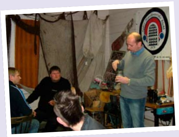
MOTORPROBLEMER KAN LØSES!