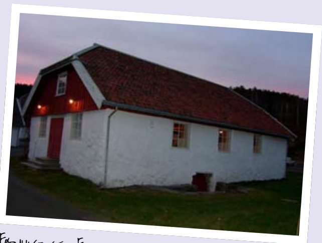
FØRJULSFEST I FRØLAND