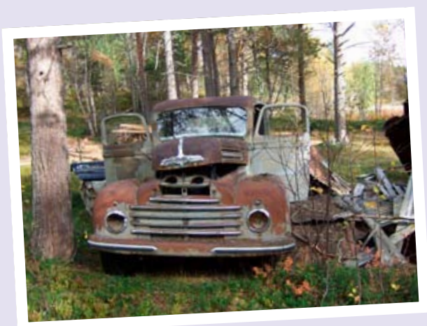
KAN DENNE REDDES?