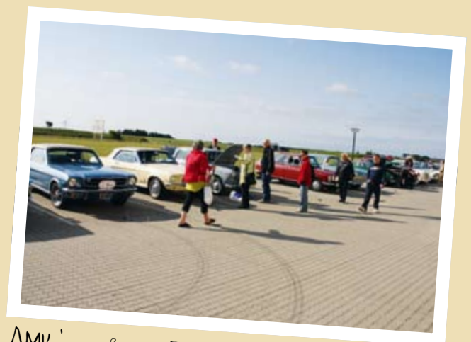
AMK'ERE PÅ LØP I DANMARK