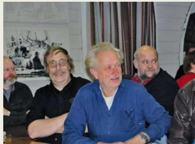
Stoffet som gjennomgås, er også interessant for veteraner