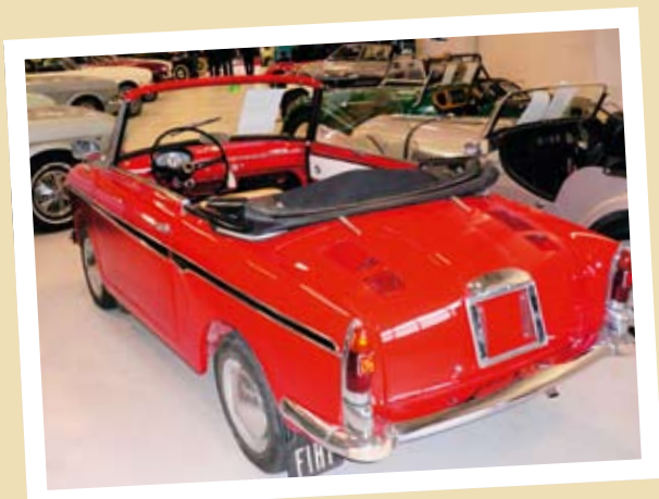
PÅ DELEMARKE I HERNING