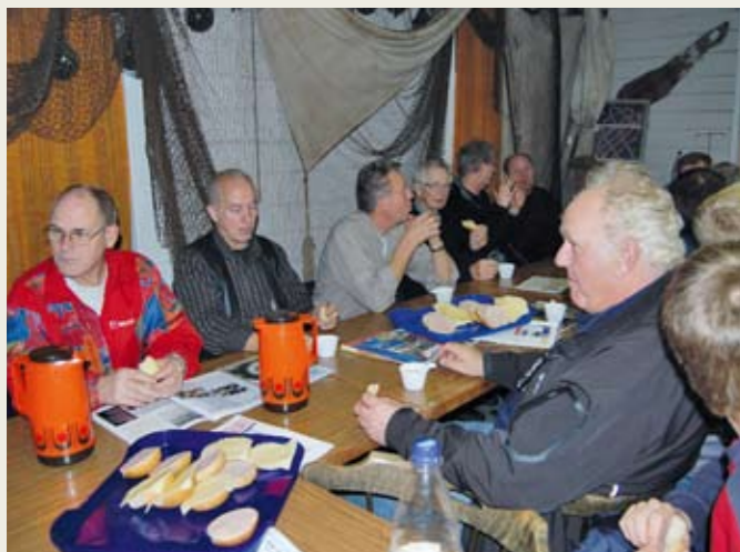
Kaffe og litt å bite i hører med