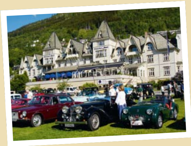
NORGESLØPET 210 TAR FORM