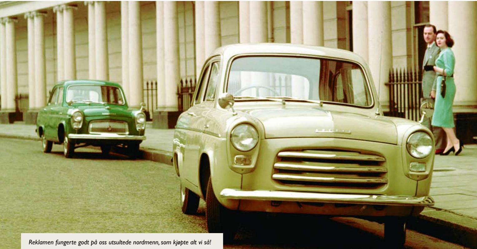
Reklamen fungerte godt på oss utsultede nordmenn, som kjøpte alt vi så!