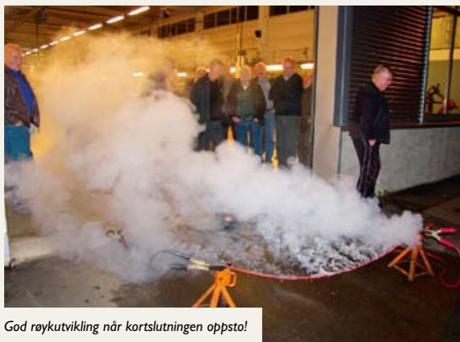
God røykutvikling når kortslutningen oppsto!