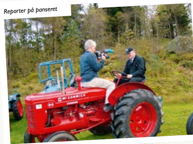
Reportar på panseret