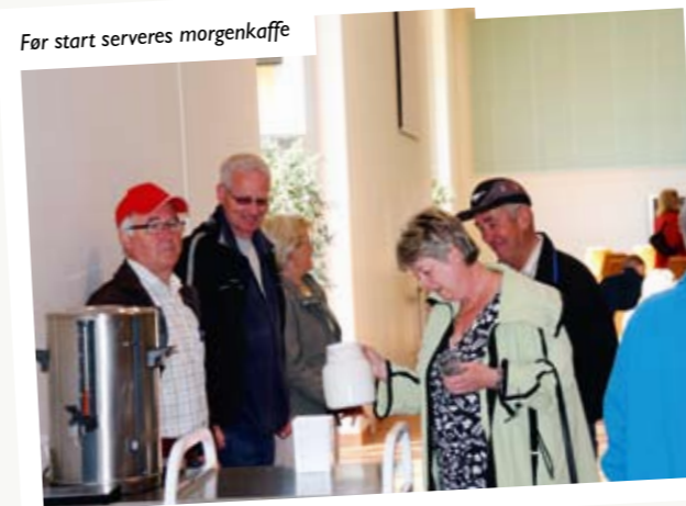
Før start serveres morgenkaffe