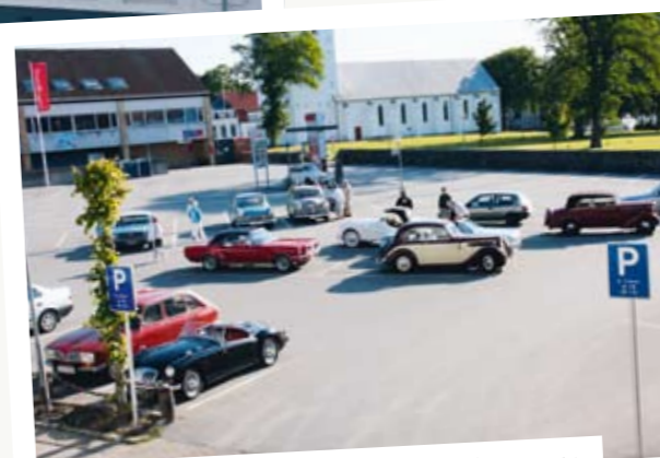
Her er bilene klar til avgang til løp – tidlig en søndags morgen