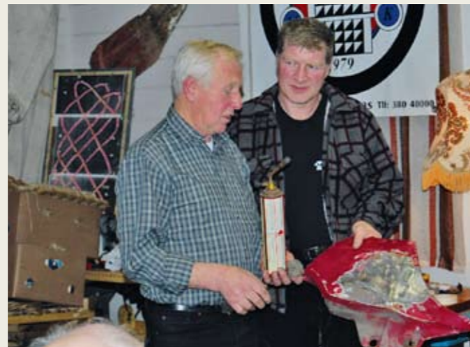
Her er det også individuelle råd å få