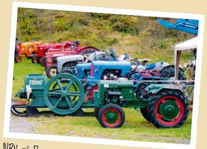
NRK PÅ BJODLAND